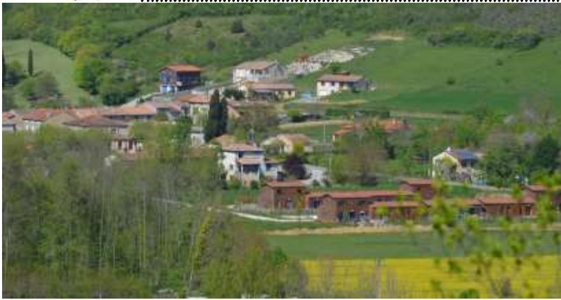
Village de Dun.