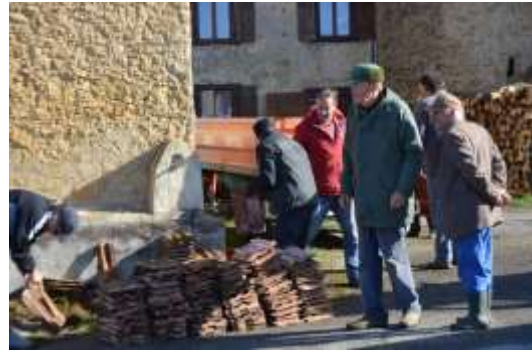
St Pastou, des habitants attentifs.