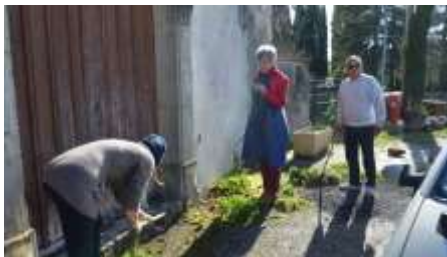
Engraviès, désherbage devant l'église.