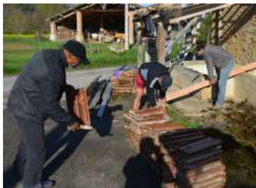
St Pastou, brossage des tuiles.