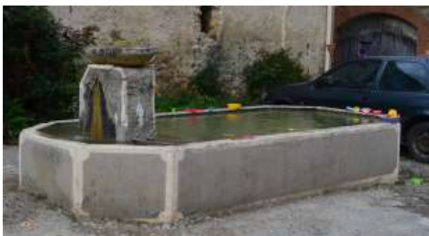
Bassin et lavoir après travaux.

Nous avons clôturé cette matinée par des boissons apéritives et des grillades offertes par la mairie.