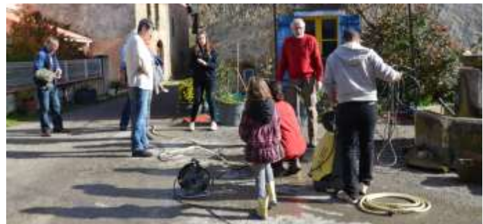
Engraviès, préparation nettoyage du bassin

Dans la continuité du premier chantier citoyen qui s'est déroulé au mois de septembre dernier au Merviel, une équipe encore plus nombreuse, intergénérationnelle et de toute la commune, s'est rassemblée samedi 9 avril à St Pastou et à Engraviès pour un programme chargé : à St Pastou, intervenir sur le lavoir, débroussailler la fontaine des Sept Founts, à Engraviès : nettoyage du local à poubelle, du bassin, de la source, et des herbes folles sur les bas – côtés du pont, de la rue et devant l'église.