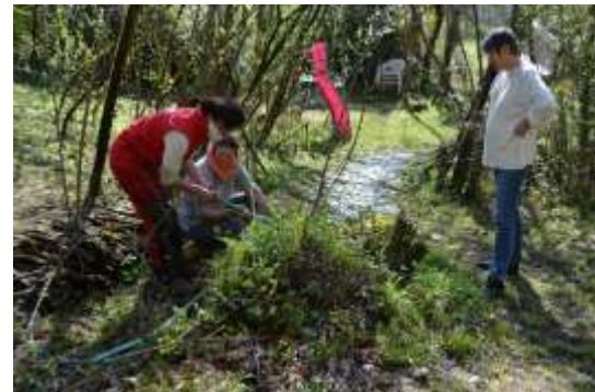
Engraviès, nettoyage de la source.