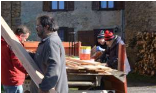
St Pastou, brossage des tuiles.