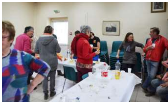
Salle d'animation d'Engraviès, repas convivial.

La bonne humeur a régné toute la matinée et s'est terminée par les délicieux produits en grillades de la vallée et les desserts du Brougal. Nous remercions tous les bénévoles, qui ont participé à cette journée de chantier collectif, des plus jeunes aux plus anciens, tous également désireux de se rendre utiles et de contribuer simplement à leur environnement de vie. Rendez-vous à l'automne pour le prochain qui se déroulera au Taychel !!!