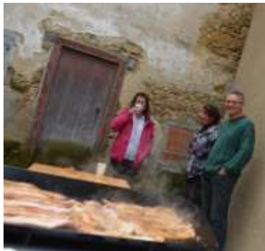
Salle d'animation d'Engraviès, repas convivial.

Cette journée, comme la première, s'est déroulée dans le plaisir de faire ensemble, et le souci de préserver notre patrimoine, sans oublier la joie de se rencontrer !