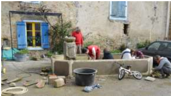
Bassin Engraviès, grand nettoyage.