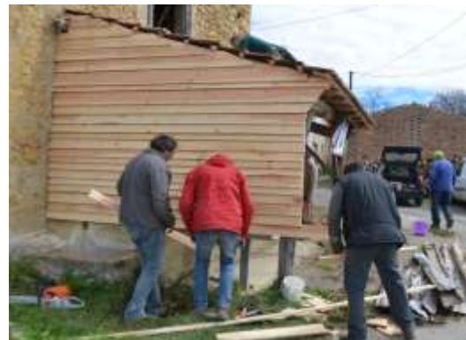
Lavoir St Pastou, bardage.