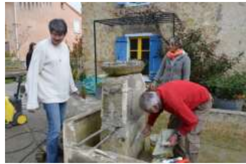
Bassin Engraviès, petite maçonnerie.