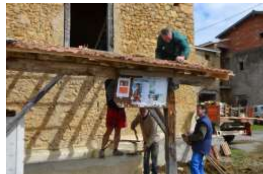
Lavoir St Pastou, chevrons et tuiles.