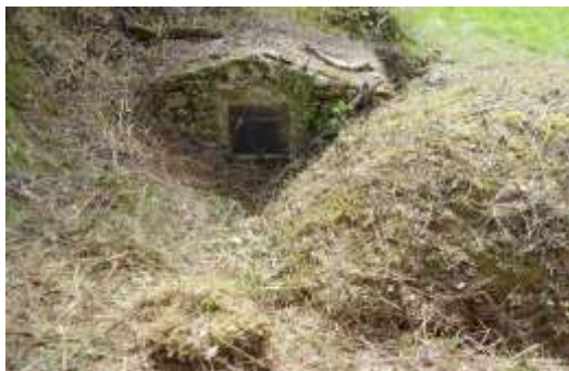
Fontaine des Sept Founts

Dans la continuité du premier chantier citoyen qui s'est déroulé au mois de septembre dernier au Merviel, une équipe encore plus nombreuse, intergénérationnelle et de toute la commune, s'est rassemblée samedi 9 avril à St Pastou et à Engraviès pour un programme chargé : à St Pastou, intervenir sur le lavoir, débroussailler la fontaine des Sept Founts, à Engraviès : nettoyage du local à poubelle, du bassin, de la source, et des herbes folles sur les bas – côtés du pont, de la rue et devant l'église.