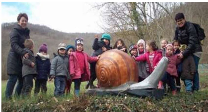
Elèves de l'école du Carla de Roquefort