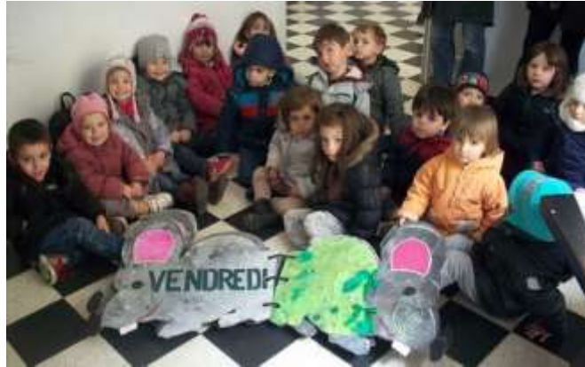
Elèves de l'école du Carla de Roquefort

Du gris pour la souris, du jaune, du rouge, du bleu, de l'orange, du vert, du violet et du blanc pour les habits de la semaine et c'est une petite comptine, point de départ d'un projet en arts plastiques mené avec l'association Avelan'arts , qui a pris la forme d'un livre objet et d'une page d'un grand livre solidaire.